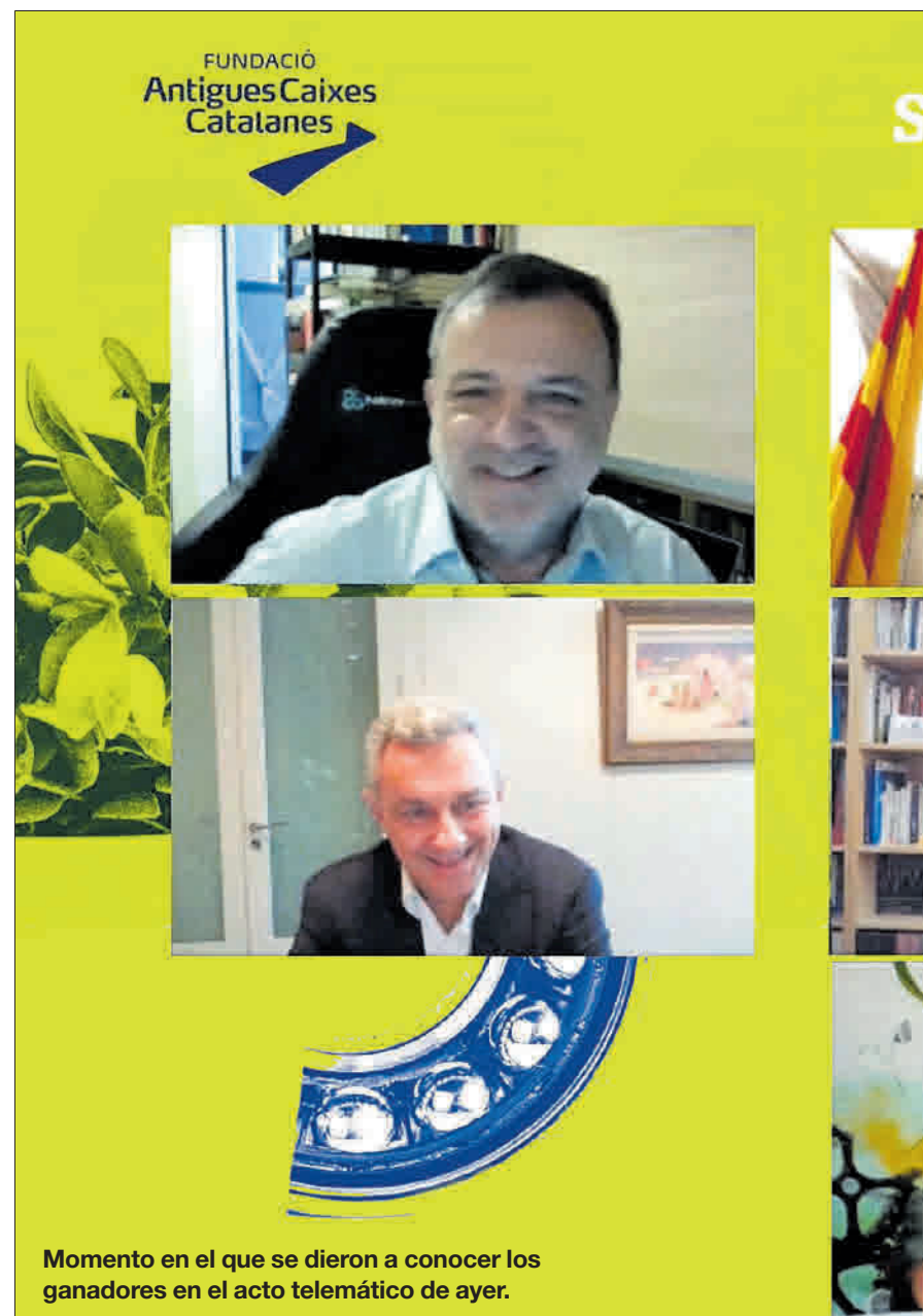
Momento en el que se dieron a conocer los ganadores en el acto telemático de ayer.

CINCO FINALISTAS // Cinco iniciativas fueron las que alcanzaron la fase final del concurso, pero tan